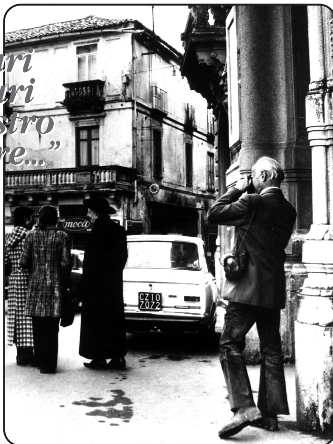
Henri Cartier - Bresson al lavoro in un reportage sul Mezzogiorno

Regna al momento disordine e discordanza nei vari stati dell'Unione Europea per quanto riguarda modi di tutela e durata del copyright, compresa la fotografia di valore giornalistico e documentario che non è chiaro in quale categoria collocare, magari in una particolare... Va in oltre puntualizzato in termini economici il valore delle immagini usate in opere didascaliche, antologiche e comunque di carattere scolastico. Si pone poi anche il recente