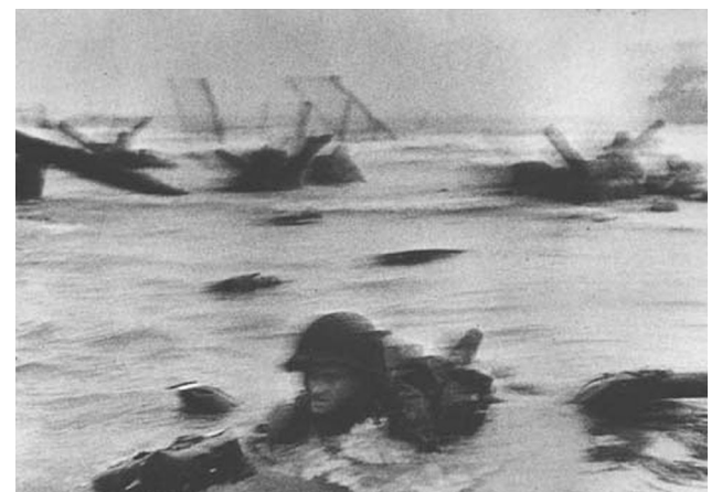
La prima ondata sulla spiaggia di Omaha, Normandia (1944)