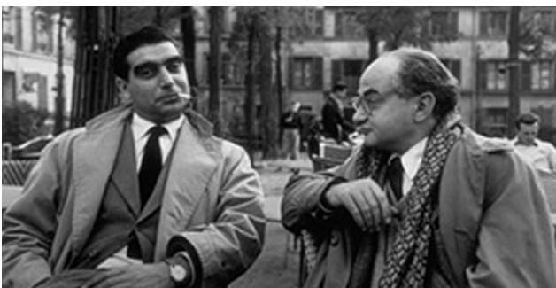
Bob Capa e Seymour fotografati da Henri Cartier-Bresson, Parigi (1950)