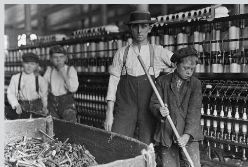
Lewis Hine: piccoli garzoni e filatori in un grande cotonificio di Lancaster (1908)

L'impegno sociale di Hine spingerà il Congresso alla ratifica di leggi innovative per la protezione dei minori. L'ultimo importante lavoro del grande fotografo sarà rivolto, ottenendo fantastiche ed arditissime immagini, a documentare la costruzione dell'Empire State Building, il grattacielo di New York che sarà per decenni il più alto del mondo, con i suoi oltre trecento metri. Questo nei primi anni '30 a simbolo indomito della vitalità e del progresso di un'America affranta ma non vinta dalla Grande Depressione iniziata del '29 e che avrà il suo riscatto con il New Deal di Roosevelt. Sicuro iniziatore della fotografia sociale, Hine fu antesignano di alti esempi quali Brassai e Doisneau, esploratori attenti del sottobosco parigino: in modo più soft l'inossidabile-